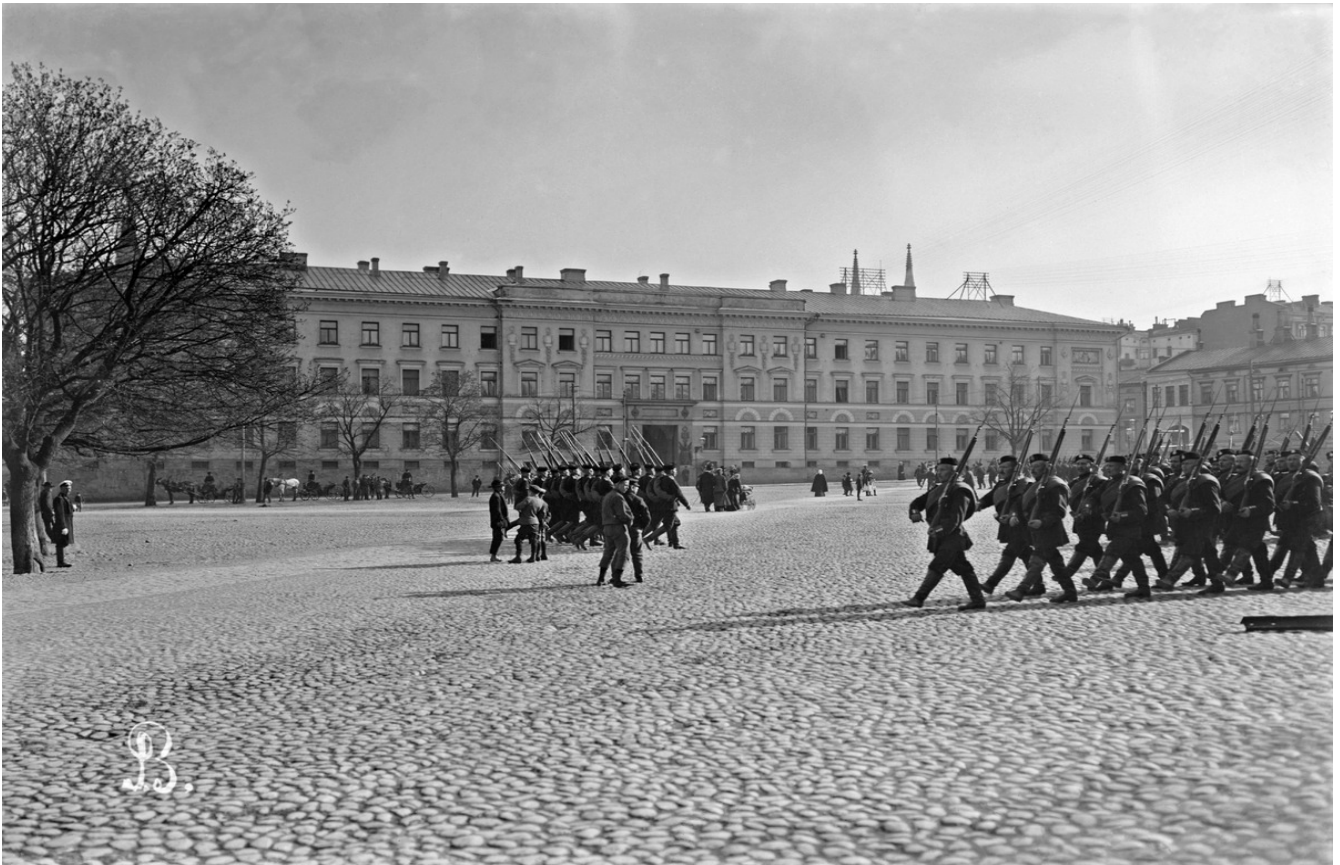
Kasarmitori ennen vuotta 1905.