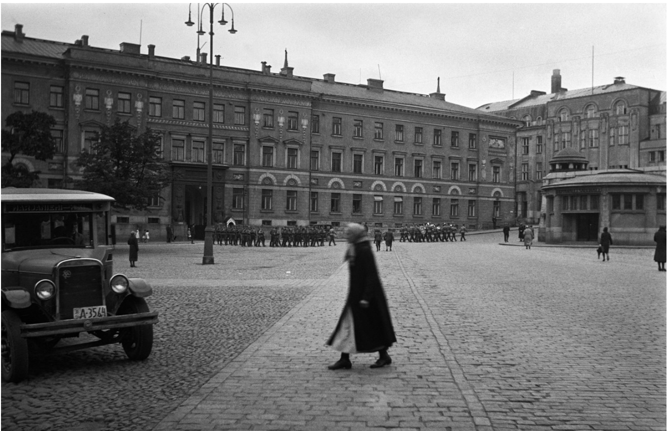
Kasarmitori 1930-luvulla.