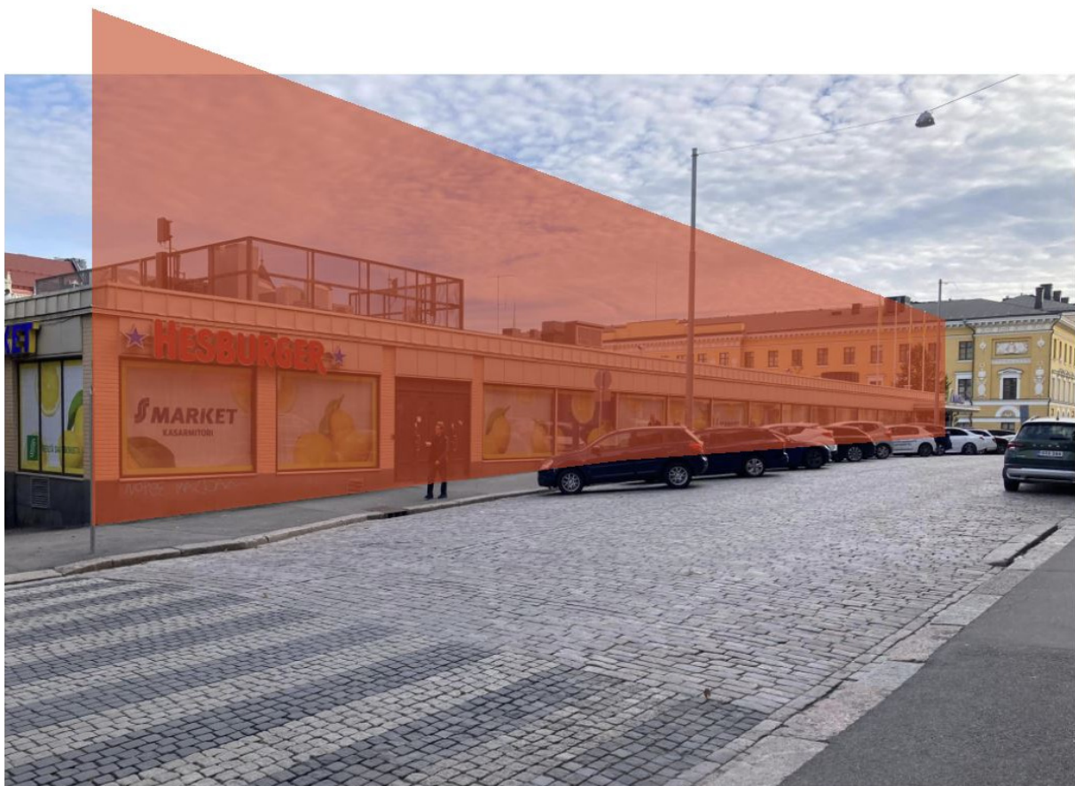
Näkymä Kasarmikadulta. Suunnitellun toimistotalon massa esitetty punaisella.