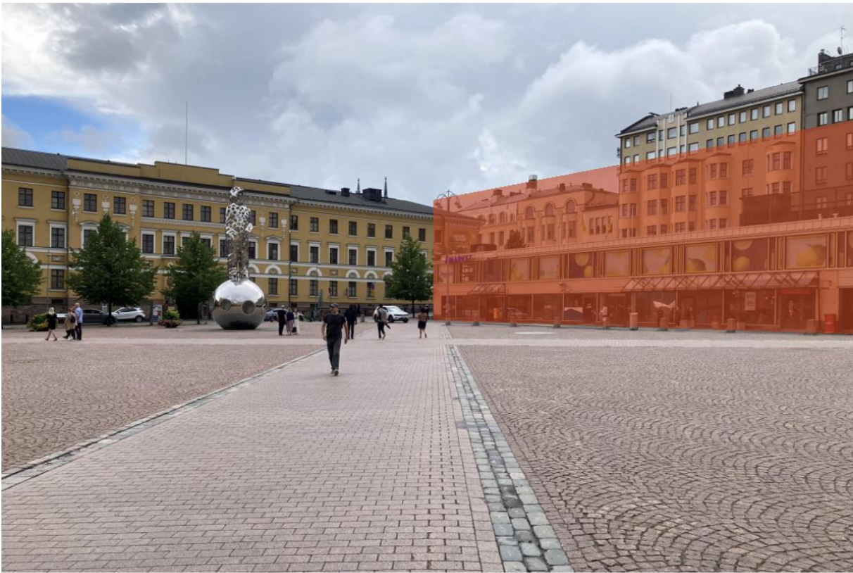
Näkymä Kasarmitorilta. Suunnitellun toimistotalon massa esitetty punaisella.