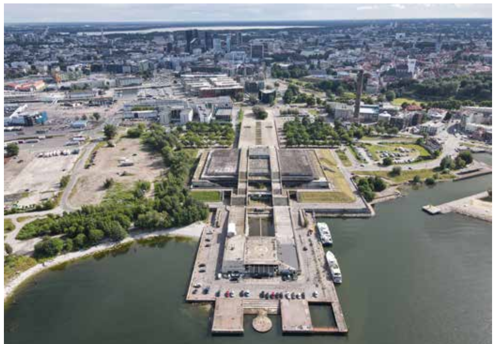
Illustration from the current detail plan of the area. Tallinna linnahalli ja lähiala detailplaneering, adopted on 5.10.2017.