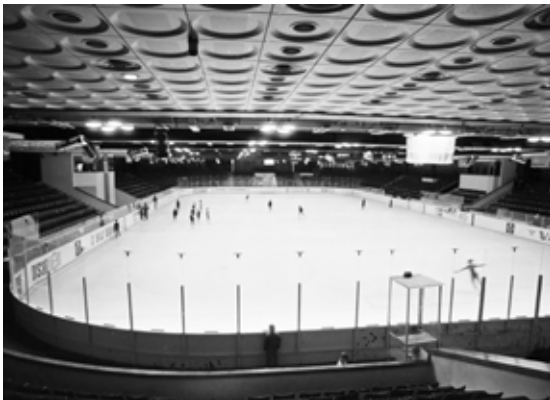
View of the concert hall, 1980s.