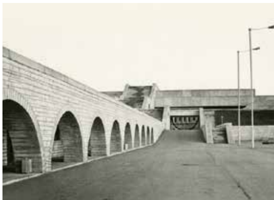
View of part of the building from the sea. 1980s.

The construction of this large complex was completed in 1980. Located by the waterfront, its proximity to the passenger port, seating capacity of 4800 people, the ice rink (for 3000 people), and bowling alley and cafés, turned it into a great place for Tallinn's residents as a cultural venue, while adding a remarkable element in the city's design. From point of view of urban planning, the idea of the whole complex was to create a view to the Old Town and to connect it to the Civic Center with a pedestrian boulevard. Being as wide as the Viru Hotel facade, the design also meant