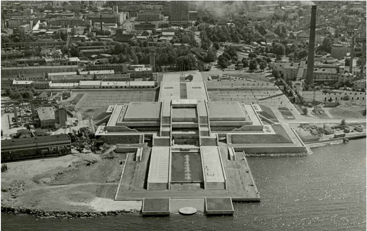
Estonian Museum of Architecture (EAM), Fk 5965.

Aerial view over the Linnahall complex from the 1980s. The centre of Tallinn with the Viru hotel highrise can be seen in the background.