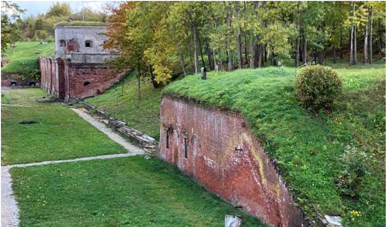
Kuva Marianne Lehtimäki

Osallistuin lokakuun 2022 alussa eurooppalaisen EFFORTS-linnoitusverkoston foorumin Kaunasissa. 1800-luvun venäläisten rakentamassa patterissa pidetyssä työpajassa pohdittiin linnoitusperinnön uudelleenkäytön tapoja. Ukrainan edustajan Olha Tikonovan puheenvuoro hiljensi: ”Meillä uudet korkeat kerrostalot hajoavat pommituksissa kuin korttitalot. Tällaiset patterit ovat osin maan sisällä, paksuseinäisiä ja rakennettu kestämään. Meillä niitä on otettu käyttöön kotinsa menettäneiden suojina.”