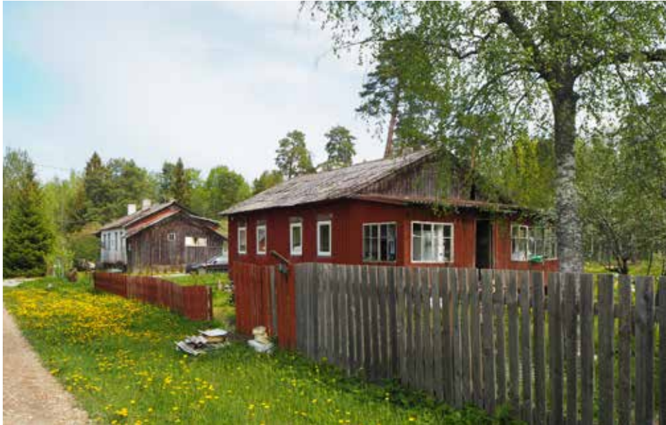
Kuva Kristo Vesikansa