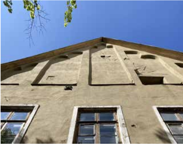
Pikk-katu 43:n vanha kauppiasantalo.

on vielä tekemättä. Virolaisia vertaiskohteita ei toistaiseksi tiedetä löytyvän kirkoista, mutta ICOMOSin ekskursion pästäin katsomaan keskiaikaisen kauppiastalon kattorakenteita Tallinnan Pikk-kadulla. Talossa ovat säilyneet alkuperäiset kattorakenteet vuodelta 1434. Rakenne on siis tehty vain muutamaa vuotta aiemmin kuin Pernajan kirkon vuonna 1440 rakennetut ja vuonna 1450 muutetut kattotuolit.