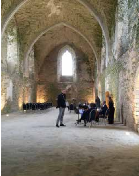
Padisen entisen sisterssiläisluostarin kirkon salissa valmisteltiin konserttia.