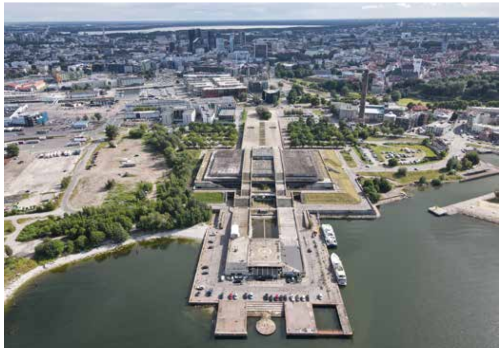
Illustration from the current detail plan of the area. Tallinna linnahalli ja lähiala detailplaneering, adopted on 5.10.2017.