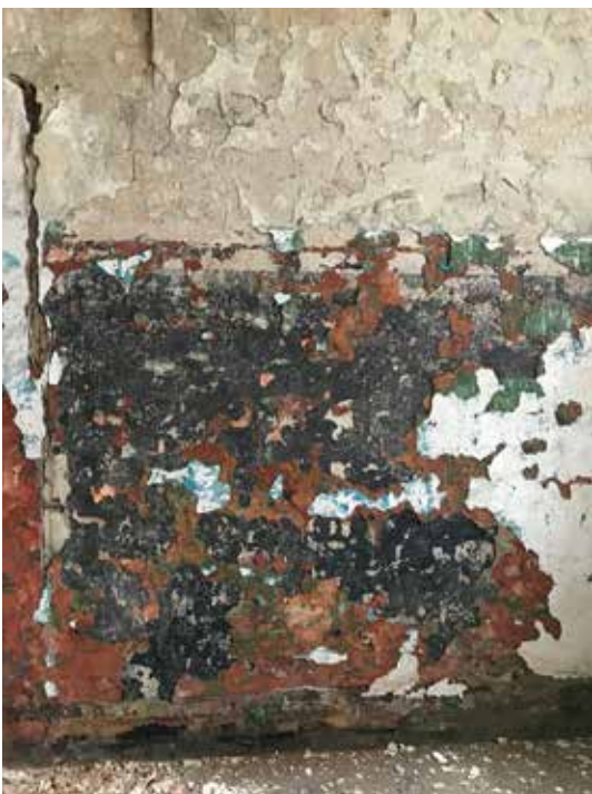
Kuva Laura Berger