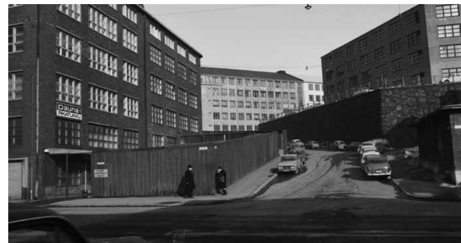
Näkymä Vallilan teollisuusalueelta Lemuntien suuntaan. Vasemmalla Pauna Oy:n pikatukku, Elimäenkatu 25. Mäellä oikealla puolella on Pälkäneentie 19. Kaupunkiympäristölautakunta kaatoi vuonna 2020 Vallilan teollisuusalueen ominaispiirteitä säilyttävän kaavaehdotuksen, jota Osmo Soininvaara kutsui "söpöksi ideaksi". Kaavaehdotuksen taustalla oli pyrkimys säilyttää alueen vanhaa ja uutta toimintaa, kuten asutusta usein häiritsevää aktiivista yöelämää. Alueen suurimmat kiinteistökehittäjät olivat tästä jokseenkin varmasti eri mieltä.

Samaan aikaan kaupunki päätyi myymään arkkitehtonisesti arvokkaita