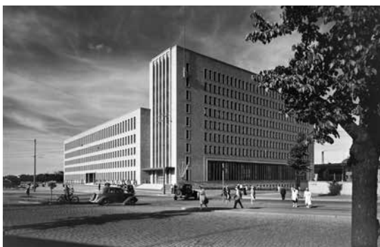
Lähinnä farssia muistuttanut poliitikkojen päätös ajaa yli Postitalon lainmukaisen suojelun ei ollut suomalaisen oikeusvaltion kirkkaimpia hetkiä. Kuva Pietinen Arne Oy 1938, Helsingin kaupunginmuseo.

Uuden kaupunkiympäristön toimialan johto koostuu toimialajohtajasta, hänen alapuolellaan olevista neljästä palvelualueiden johtajasta ja näiden alapuolella olevista 21 päälliköstä. Vaikka hallintouudistusta markkinoitiin avoimuudella ja demokratialla, palvelualueiden johtajat nimitettiin ilman