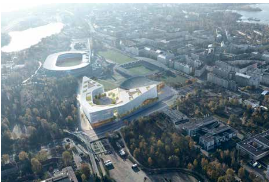
Vuoden 1970 ilmakuvassa Eläintarhan urheilupuistoa määrittävät vapaasti maisemassa sijaitsevat rakennukset. Etualalla on vuonna 1966 valmistunut, arkkitehtien Jaakko Kontio ja Kalle Räiken suunnittelema Helsingin jäähalli. Vasemmalla jäähallin pysäköintikenttä, jonka alta hävitettiin kaupunginpuutarhuri Svante Olssonin suunnittelema puisto, vuonna 1911 valmistunut koulu puutarha.

Helsinki Garden -hanke vertautuu jättimäisenä niin kaupunkikortteleihin kuin läheisiin urheilurakennuksiin. Viitesuunnitelman ilmakuva, Arkkitehtuuritoimisto B & M Oy 2019.