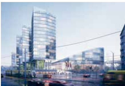
Näkymä Reijolankadulta, jossa vanha Jäähalli jää ikään kuin jättihankkeen piharakennukseksi. Viitesuunnitelma, Arkkitehtuuritoimisto B & M Oy 2019.

Kilpailuvaiheen suunnitelmassa julkisivujen käsittelyssä oli mittakaavaa kommentoivaa kuviointia, joka karsittiin myöhemmin pois. Arkkitehtuuritoimisto B & M Oy, 2016.