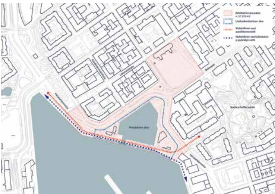
Hietalahdenrannan huoltoasema-ravintola ja sen paikalle suunniteltu toimistotalo.