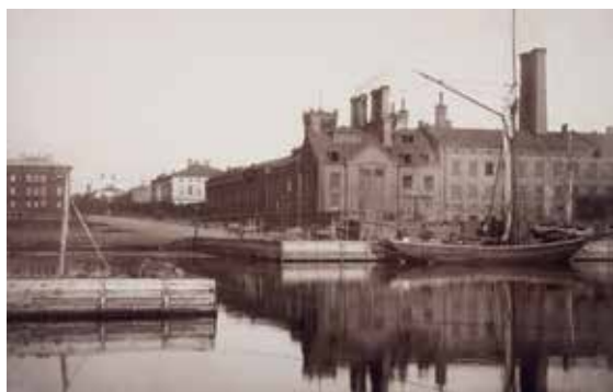
Hietalahdenranta ja Bulevardin pää 1880-luvulla.

Helsingin strategiat ja todellisuus eivät siis kohtaa. Tämä on seurausta siitä, että suunnittelu on muuttunut sijoittajavetoiseksi, ja kilpailuttaminen ja kaupunkilaiset ohitetaan. Satamalta ja teollisuudelta vapautuvia rantoja