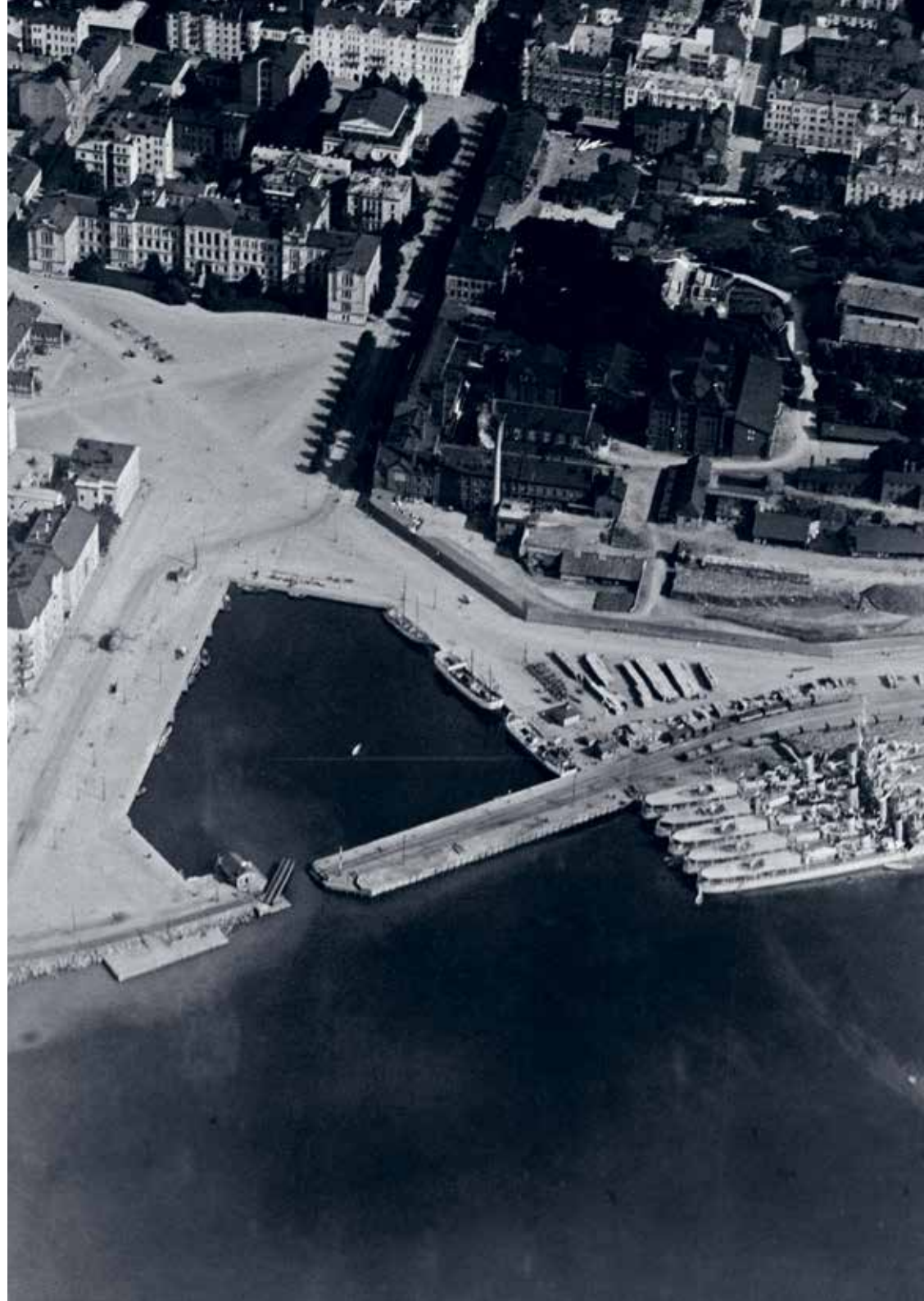
Ilmakuva Hietalahdenrannan alueesta vuodelta 1924. Satamaradan linjaus rajaa Hietalahdenaltaan, jonka muoto vastaa täysin nykytilannetta.