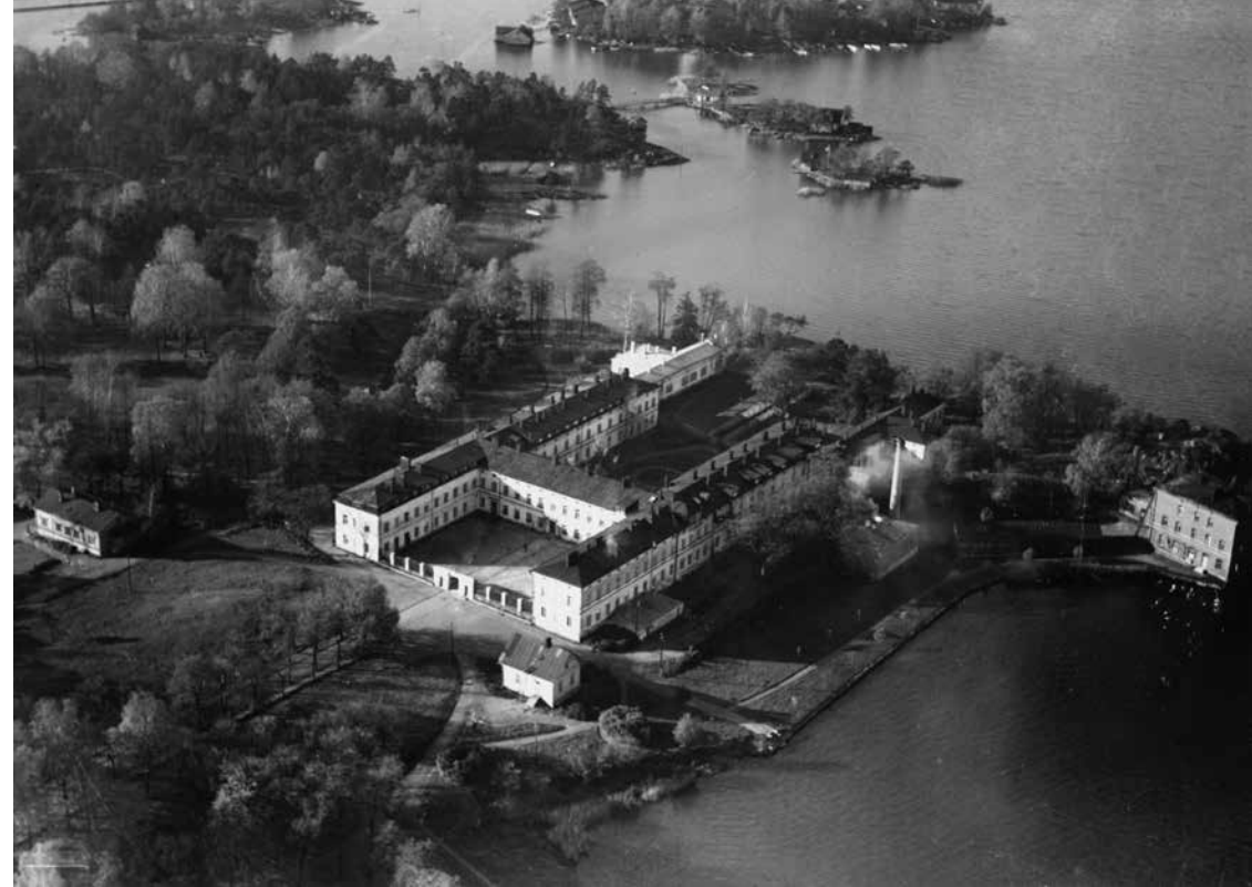
Lapinlahden sairaala, Lapinniemi. Taustalla ylhäällä saaret Sulhanen ja Morsian, Pikku Pääsi ja Iso Pääsi. Kuvassa puisto on vielä laaja ajalta ennen Länsiväylän rakentamista. Kuva R. Roos 1930-luku, Helsingin kaupungin museo.

Vihreä ja merellinen Helsinki 2050. VISTRA OSA 1: lähtökohdat ja visio https://www.hel.fi/hel2/ksv/julkaisut/aos_2013-4.pdf