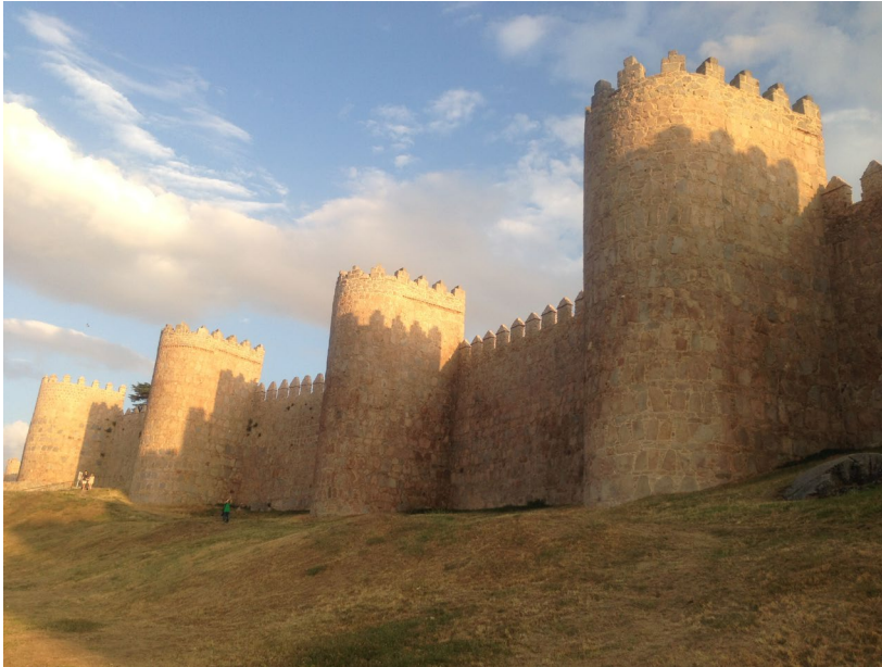
Avilan keskiaikaisia muureja.