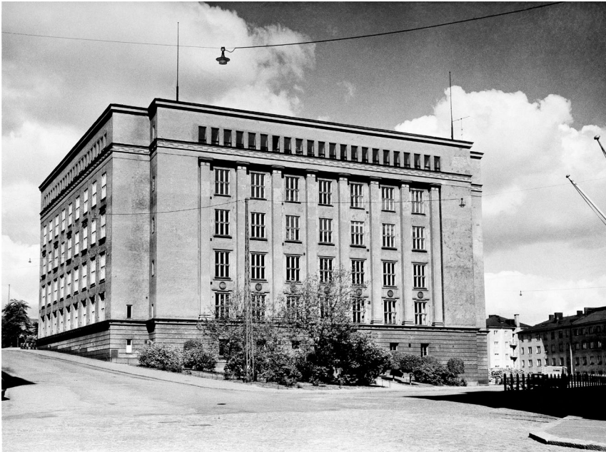
Helsingin Teknillinen oppilaitos 1950-luvulla.

Kojamo osti vuonna 2017 Metropolialta entisen Helsingin teollisuuskoulun koulurakennuksen. 91-vuotiaaseen, suojeltuun arvorakennukseen on suunnitteilla vuokra-asuntoja ja liiketiloja, jotka voisivat valmistua aikaisintaan vuonna 2023.