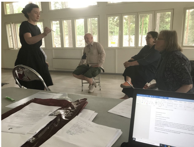
ICOMOSin Suomen osasto sai pidettyä vuosikokouksen Hietsun paviljongissa 16.6.