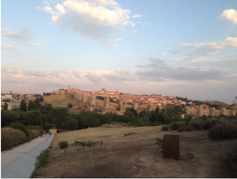
Avilan keskiaikainen kaupunki.

oli Avilasta ja sen politeknisestä yliopistosta, Fabio Remondino puolestaan on CIPASTA ja ISPRS:stä ja johtaa EUn projektia Italiassa.