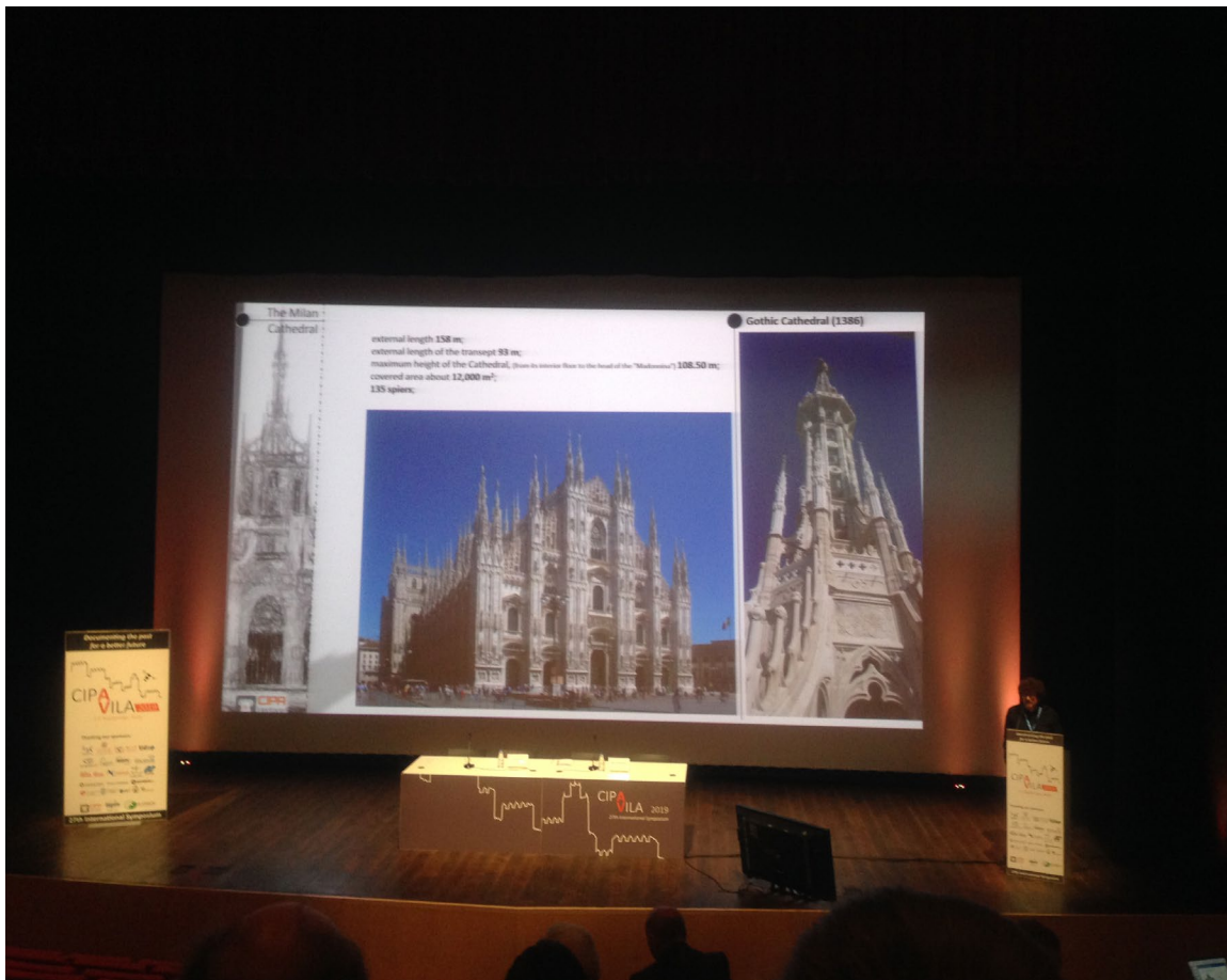
Milanon katedraalin dokumentointia ja restaurointia käsittelevä keynote.