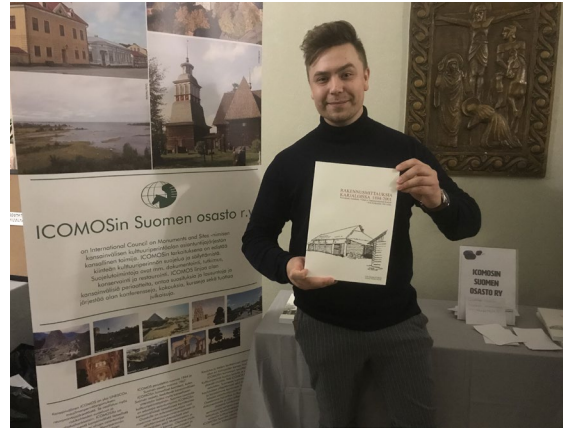
Sihteeri Tieteiden yössä ICOMOSin Suomen osaston esittelypisteellä 16.1.2020.

Kokouksessa todettiin, että mitä perustettu “nyrkki” alkaa tekemäänkään, tekijöiden pitää olla nykyarjessa aktiivisesti mukana olevia henkilöitä, jotka voisivat kertoa, miten vihaiseksi nykyihminen tulee, kun asioille ei tehdä mitään. Tarvitaan höyry päälle. Tätä intensiteettiä päästään vielä myöhemmin kuulemaan!